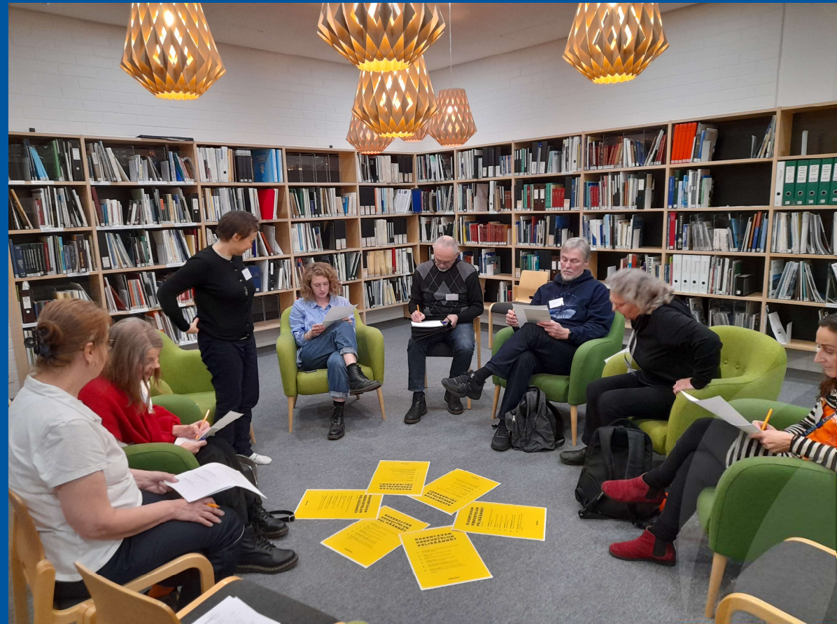
Palautelomakkeiden täyttöä Lahden pääkirjastossa.

”Kiitos paljon tästä tärkeästä arvokkaasta tilaisuudesta. Tulen hyödyntämään tätä tietoa työssänikin.”