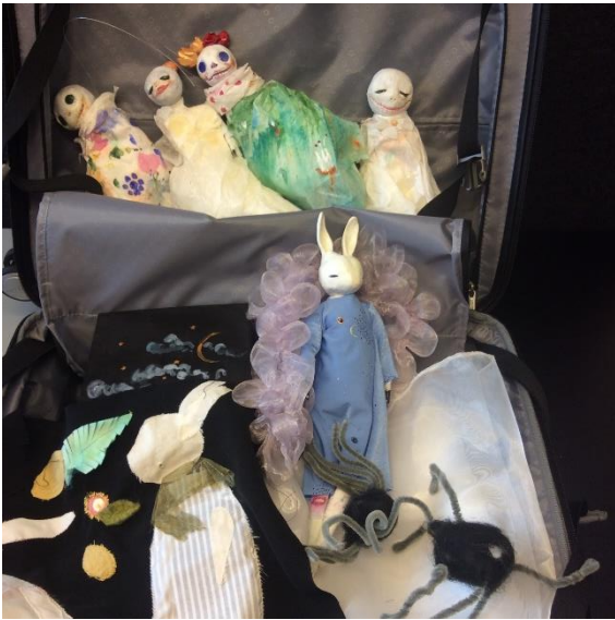
+ lorupussi (kaksikielinen)

Lue ääneen kirjaa Ennen näkymättömiä eläimiä (Ulf Stark). Lapset saavat piirtää kuulemiaan eläimiä. Läs högt ur boken Djur som ingen sett utom vi (Ulf Stark). Låt barnen rita fantasidjur.